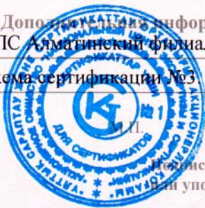
Схема сертификации №3

Подпись руководителя органа по подтверждению соответствия или уполномоченного им лица